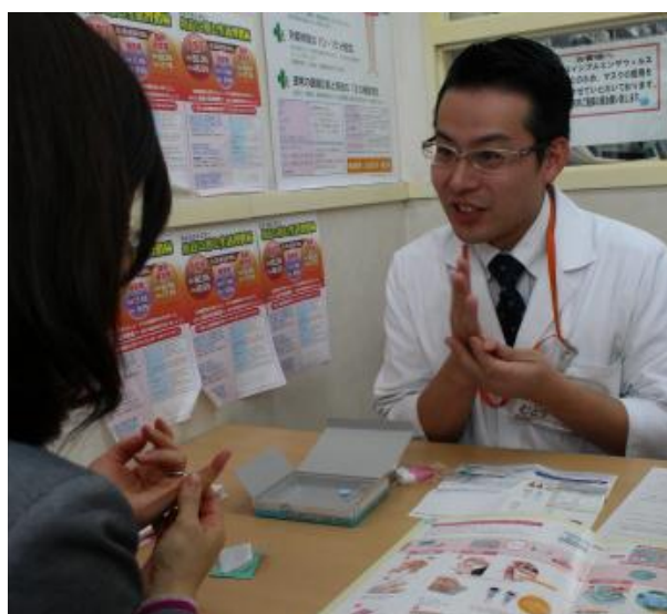
写真：自己採血の様子