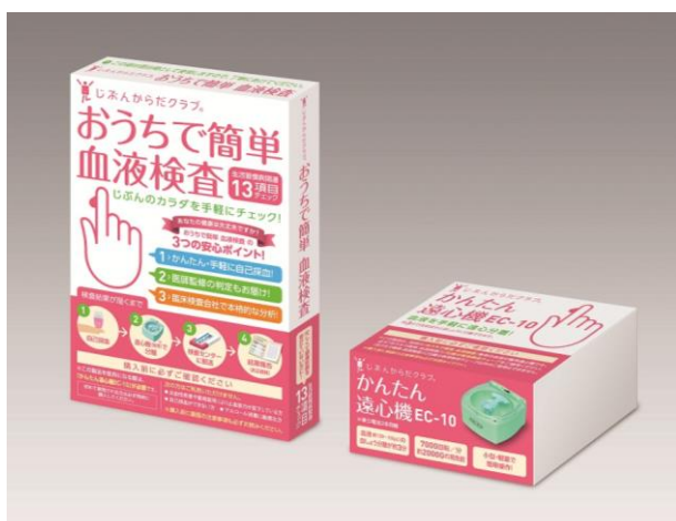
写真②：郵送検診で使用するキット(イメージ)